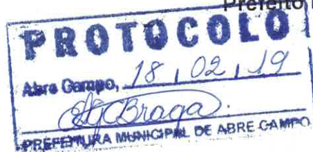
Márcio Moreira Vítor Prefeito Municipal